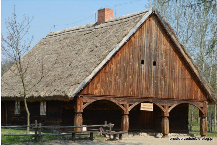
Skansen w Kłóbce