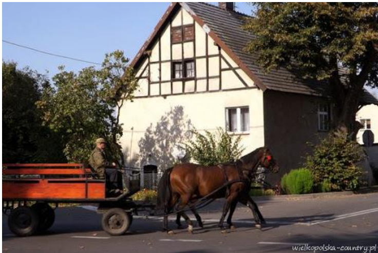
Nowoczesna zabytkowa wieś Gołęczewo